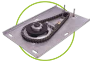
Banderola con reducción por cadenas Chain reduction base