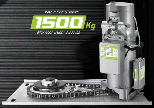
SISTEMA DE APERTURA PARA CORTINAS ENROLLABLES ROLL - UP DOOR OPENING SYSTEM

3 years limited warranty años de garantía limitada